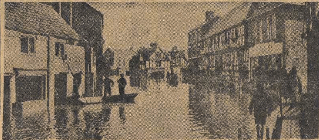
Na skutek długotrwałych deszczów szereg rzek w Anglii wystąpiło z brzegów. Szczególnie silnie wylała rzeka Severn w hrabstwie Shrewsbury i Worcester. Na il. — miasto Shrewsbury pod wodą.