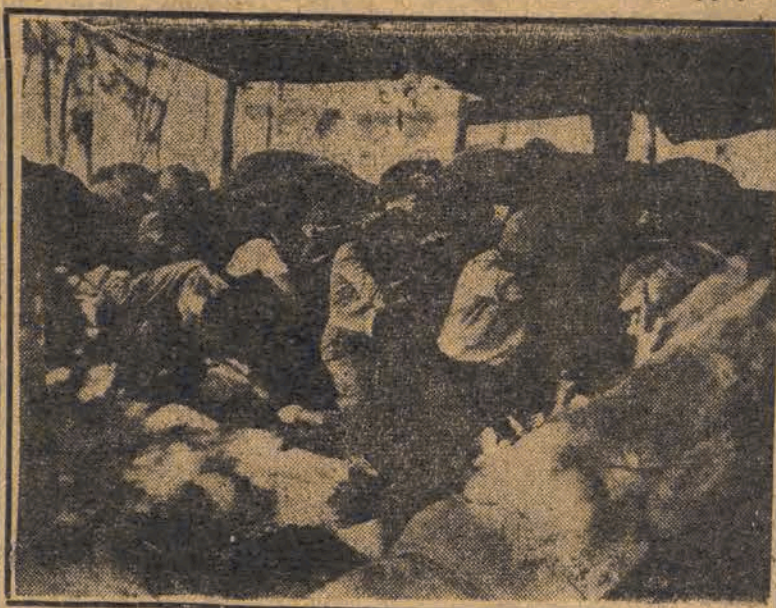
Członkowie żydowskiej organizacji Haganach w walce z nacierającymi oddziałami arabskimi.

Do „Złotego Wybrzeża“ wysłano 2 brytyjskie okręty wojenne. Dziennik pisze, że „dla bezbronných Murzynów, których rozstrzeliwuje się bezlitośnie, oświadczenia rządu Partii Pracy, że Wielka Brytania przestała być mocarstwem imperialistycznym, pozbawione są siły przekonywującej“.