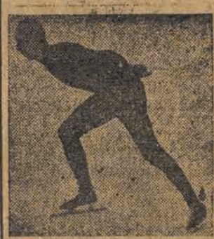
na łyżwach ZSRR w jeździe szkiej

MOSKWA (obsł. wł.). Ubiegły miesiąc obfitował w Związku Radzieckim w poważne imprezy sportowe.