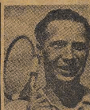
Ozerow, 2-ga rakieta ZSRR

W poniedziałek dnia 8 marca rb. o godz. 19-ej odbędzie się w Sali Sportowej TUR (Helenów) przy ul. Północnej 36 Akademia związana z Międzynarodowym Dniem Kobiet w połączeniu z częścią koncertową w wykonaniu orkiestry, chóru, sekcji tańców ludowych, recytatorek solistek (ów), śpiewaczek (ów), Związku