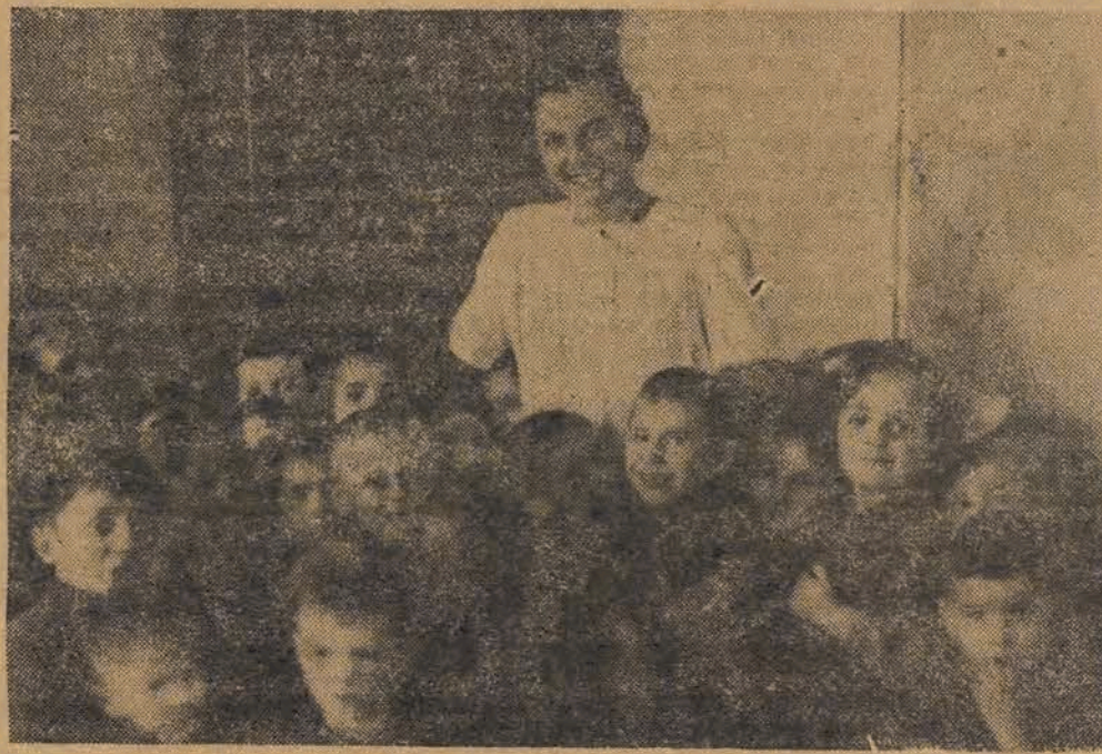
„Nie — od — da — my — na — szej — pa — ni!”

— Stała się wielka sprawiedliwość dla pilnych, pracowitych jak mrówki piotrkowskich hutników. Dziś huta jest ich własnością. Ich dzieci bawią się w wielkopańskim pałacu i rosną pod dobrą opieką na zdrowych, silnych, oddanych Nowej Polsce obywateli.