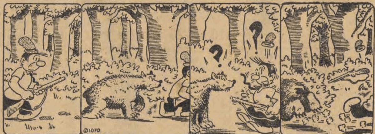
Na łowy! Nie—dźwiedź! Ojoj! Obaj się przelękli!