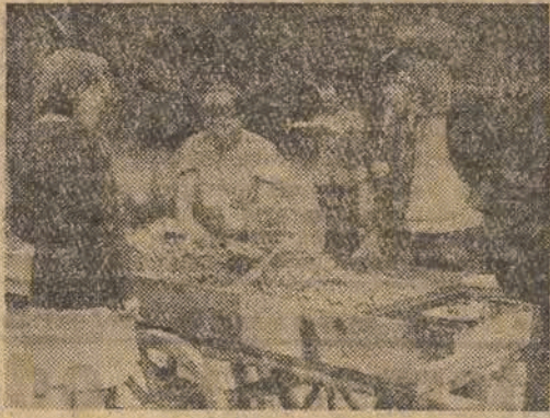
PZPB Nr 1 codziennie dostarczą swym robotnikom ziemniaki z własnej fermy — po cenach o połowę niższych, niż na rynkach. Nie brak też „scheblerowcom” i owoców.