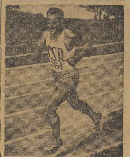
ZATOPEK (CSR), mistrz olimpijski w biegu na 10.000 mtr. uległ w Amsterdamie Szwedowi Ahldenowi i Holendrowi Slijkhuisowi — w biegu na 3.000 metrów, zajmując dopiero 3-cie miejsce. D-023540

Podane powyżej nazwiska nie przesądzają ostatecznie składu reprezentacji na Igrzyska Bałkańskie.