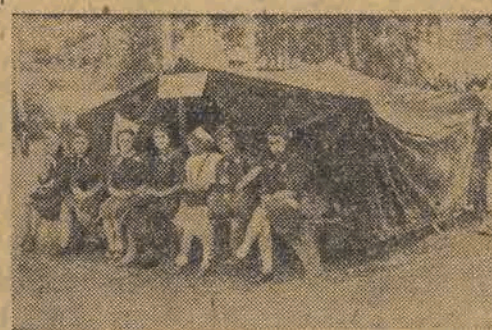
Młoda ekipa w pogotowiu niesienia doraźnej pomocy