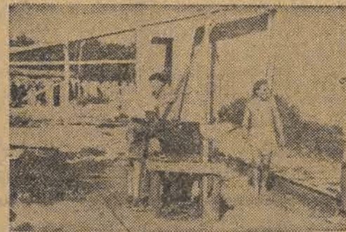
W ciepłe słoneczne promieni rażno i lekko się pracuje