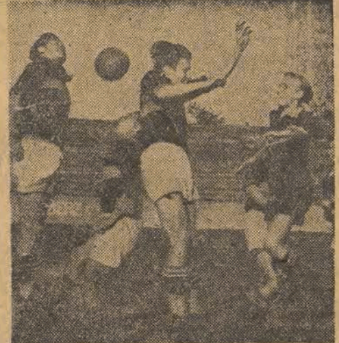
Nasza młodzież piłkarska dotychczas rozgrywała mecze przy pustych trybunach. Dzisiaj przyglądać jej się będzie cała Łódź sportowa.

wynikiem remisowym 2:2. Wysoka klasa młodych piłkarzy węgierskich, oraz wzniosły cel, na jaki rozegrane zostanie to międzynarodowe spotkanie, ściągają niewątpliwie tłumy widzów na stadion ŁKS-u. Dzisiejszy międzynarodowy mecz juniorów Węgry Polska otrzyma takie same ramy organizacyjne, jak każde spotkanie międzypaństwowe. Stadion udekorowany będzie flagami obydwu państw, a przed spotkaniem odegrane zostaną obydwa hymny państwowe. Czego możemy oczekiwać po dzisiejszym spotkaniu? Takie pytanie niewątpliwie zada sobie nie jeden z miłośników piłkarstwa, który wybierze się dzisiaj na stadion ŁKS-u. Śmiało możemy tych wszystkich zapewnić, że nie zawiodą się. Dzisiejsza gra może być nawet lepszą od jutrzejszej gry na stadionie W. P. w Warszawie, gdzie spotkają się oficjalnie nasze reprezentacje państwowe, gdyż prawie wszyscy młodzi piłkarze węgierscy, chociaż