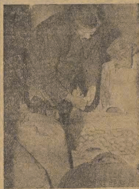
Cukier — i nie tylko cukier znaleziono w mieszkaniu kupcowej St. Kusideł (ul. Armii Czerwonej 9)