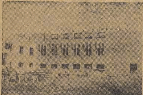
W zręcznych dłoniach robotniczych cegły tylko migają — i dalsze piętro powstaje