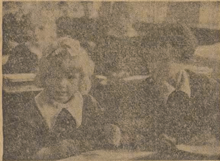
Siedmioletnie dziewczęta nie mogą się doczekać końca lekcji. Już jutro pojedą własną koleją w daleki świat przygód, gdzie czeka na nie słońce, powietrze i woda