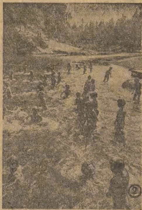
Leśny strumień zaroił się dziatwą z miasta. Co tu krzyku i wrzawy. Siedmioletki pluszczą się w kryształowej wodzie jak rybki — pod opieką starszych pionierów, które czuwają nad wszystkim