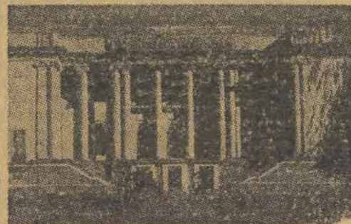
Władze ZSRR krzewią kulturę w najdalszych zakątkach kraju. Wspaniały budynek teatru w stolicy republiki Litewskiej, Stalinabadzie.

proletariatu angielskich nie śmieją nawet marzyć. I rzeczywistość czy oórkę górnika walijskiego, czy tkacza z Manchesteru, czy też robotnika portowego z Londynu znajdziecie na uniwersytecie w Cambridge czy też w Oxfordzie? Nie, tam ich nie puszcza i w fakcie tym, jak w kropli wody, odbija się charakter klasowy współczesnego ustroju Anglii parów i bankierów, Anglii fabrykantów i przywódców labourzystowskich, którzy zdradzili klasę robotniczą.