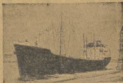
W SZCZECINIE I SWINOUJŚCIU — WIELKIE OŚRODKI RYBACKIE

W tych dniach bawił w Szczecinie minister żeglugi Rapacki oraz wiceminister Widy Wirski. W szczecińskim Morskim Urzędzie Rybackim przeprowadzono konferencję, podczas której omówione zostały ważniejsze sprawy rybackie tego terenu.