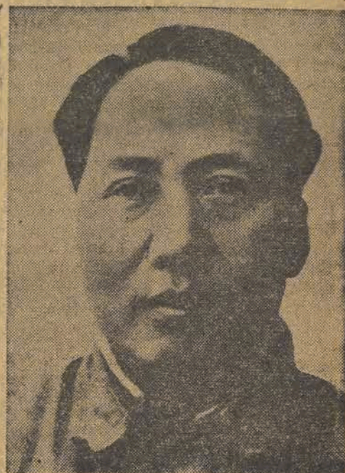
Przewodniczący Chińskiej Partii Komunistycznej — tow Mao-Tse-Tung — bohater-ski przywódca chińskich mas ludowych, walczących zwycięsko z pachołkiem imperia-lizmu Czang-Kai-Szkiem.