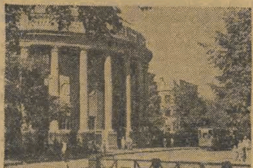
Gmach Instytutu Chem. — Technologicznego w Kazaniu

W okresie władzy radzieckiej narody Związku Radzieckiego dokonały w swym kraju ogromnej rewolucji kulturalnej. Zwycęstwo socjalizmu w ZSRR przyczyniło się do wspaniałego rozkwitu kultury radzieckiej i oświaty szerokich mas pracujących.