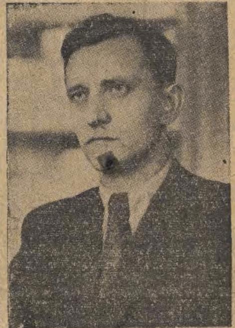
Tow. Roman Zambrowski

W dniu wczorajszym w godzinach rannych rozpoczęła się w sali Centralnej Szkoły Partyjnej III-cia konferencja Miejska Polskiej Partii Robotniczej. Referat polityczny o zjednoczeniu polskiego ruchu robotniczego wygłosił sekretarz Komitetu Centralnego, członek Biura Politycznego KC PPR tow. Roman Zambrowski. Fragmenty przemówienia tow. Zambrowskiego zamieszczamy na stronach 1-ej i 3-ej bieżącego numeru. Sprawozdanie z działalności łódzkiej organizacji PPR złożył I-szy sekretarz komitetu łódzkiego tow. Władysław Dworakowski. Streszczenie sprawozdania znajdują Czytelnicy na str. 4-ej naszego pisma. Nad referatem tow. Zambrowskiego i sprawozdaniem tow. Dworakowskiego rozwinęła się interesująca dyskusja, która w chwili zamknięcia numeru jeszcze nie jest zakończona. O przebiegu dyskusji jak również o wyniku wyborów delegatów na Zjazd Krajowy naszej Partii i Kongres Zjednoczeniowy PPR i PPS podamy w numerze jutrzejszym.