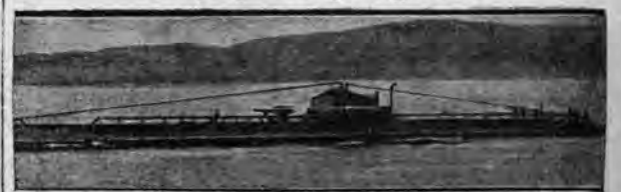
Zdjęcie nasze przedstawia francuską łódź podwodną pierwszej klasy „Perseusz”, na której nastąpił wybuch motoru Diesla, a następnie pożar. Perseusz jest statkiem tego samego typu co zatopiony niedawno „Prometeusz”.