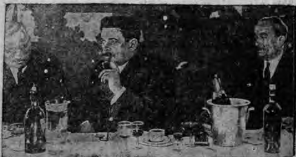
Herriot, po wygłoszeniu znanej mowy w Gramatte, w której zdemaskował zbrojenia Niemiec, na przyjęciu u burmistrza Gramattu.