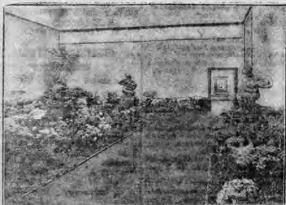
W Pałacu Sztuk Pięknych w Sztokholmie otwarto nowy rodzaj wystawy — mianowicie wystawę kwiatów i rzeźb. Obydwa rodzaje eksponatów tworzą niezwykle harmonijną całość.