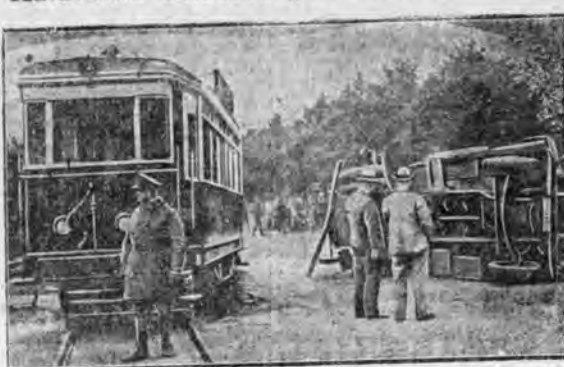
W katastrofie ponieśli śmierć dwaj Niemcy. 22 podróżnych odniosło rany.