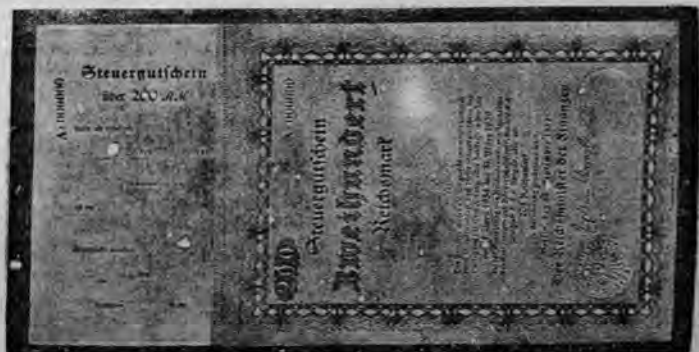
Wzór bonu podatkowego. Bony takie wypuszczono w Niemczech jako swego rodzaju pożyczkę wewnętrzną.