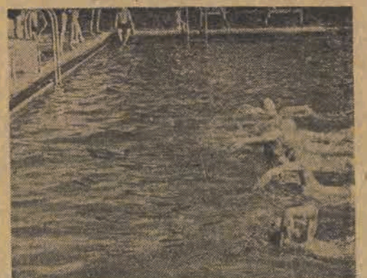
Na pływalni W. P. w Warszawie

W klasie III w klasyfikacji zespołowej zwyciężyli Metalowcy 202 pkt. przed Górnikami 196,7 i Międzyzwiązkowcami 192,8.