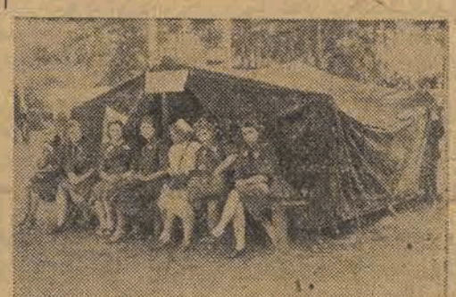
Młoda ekipa w pogotowiu niesienia doraźnej pomocy