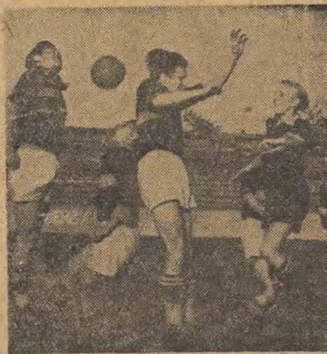
Nasza młodzież piłkarska dotychczas rozgrywała mecze przy pustych trybunach. Dzisiaj przyglądać jej się będzie cała Łódź sportowa.

Takie pytanie niewątpliwie zada sobie nie jeden z miłośników piłkarstwa, który wybierze się dzisiaj na stadion ŁKS-u. Śmiało możemy tych wszystkich zapewnić, że nie zawiodą się. Dzisiejsza gra może być nawet lepszą od jutrzejszej gry na stadionie W. P. w Warszawie, gdzie spotkają się oficjalnie nasze reprezentacje państwowe, gdyż prawie wszyscy młodzi piłkarze węgierscy, chociaż