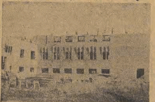
W znaczących dłoniach robotniczych cegły tylko migają — i dalsze piętro powstaje