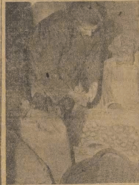
Cukier — i nie tylko cukier znaleziono w mieszkaniu kupcowej St. Kusideł (ul. Armii Czerwonej 9)