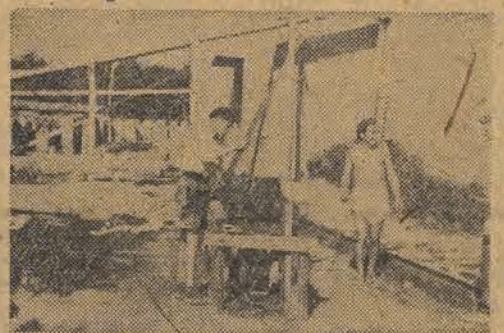
W ciepłych słońcanych promieni rażno i lekko się pracuje