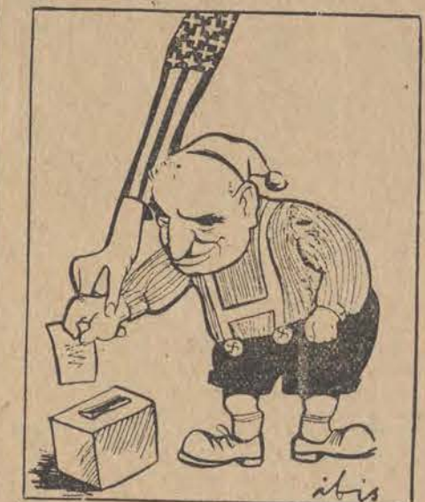
USA-nkcionowane wybory w zachodnich Niemczech

Podczas tej wizyty, która miała miejsce w ubiegłym miesiącu, Churchill przedstawił Baruchowi swój plan stworzenia „unii narodów mówiących po angielsku”, podporządkowując całkowicie W. Brytanii — USA i rezerwując dla siebie stanowisko namiestnika nowego 49-go stanu amerykańskiego, jakim miałaby się stać W. Brytanii