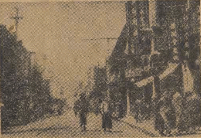
Shanghai - najruchliwsze miasto Chin - jest obecnie ewakuowane przez urzędy faszystowskiego reżimu Kuomintangu - w przewidywaniu ataku wojsk ludowych.