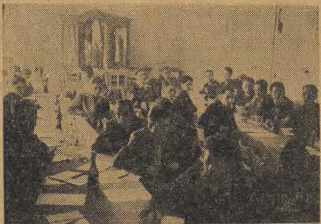
Na Plenum Zarz. Łódz. ZMP