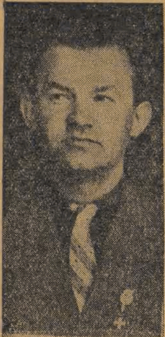
Dnia 17 bm. odbyło się plenarne posiedzenie Zarządu Łódzkiego ZMP...