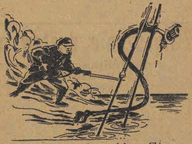
Przymusowa ewakuacja dolara z Chin

ROK II (V) ŁÓDŹ, SOBOTA 28 MAJA 1949 ROKU Nr 145 (1069)