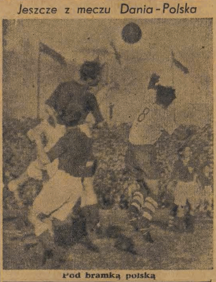
rod bramką polską