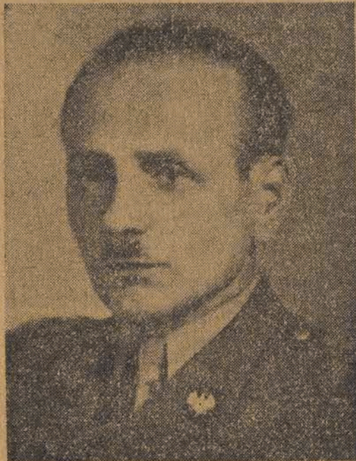
Członek Biura Politycznego KC PZPR tow. Franciszek Józwiak — Witold

W dniu wczorajszym rozpoczęła obrady I-a Konferencja Wojewódzka PZPR województwa łódzkiego.