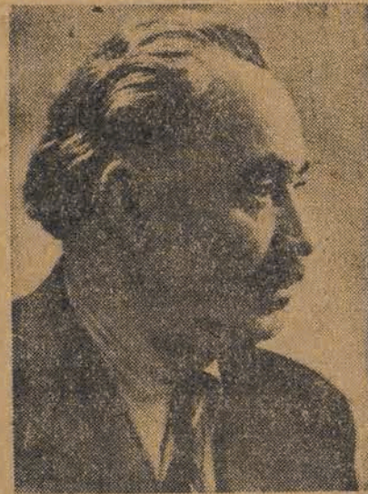
W dniu 10 lipca 1949 roku — w Mauzoleum, zbudowanym w ciągu 6 dni rękami robotników społecznych — szczątki Georgi Dymitrowa. Dymitrow nie żyje — ale hasła i idea dla której żył — żyć będą wiecznie.