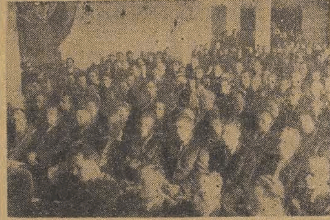
W drugim dniu obrad zebrani uważnie przysłuchiwali się wypowiedziom dyskutantów, delegatów organizacji powiatowych, miejskich i gminnych naszego województwa.