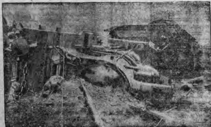
Zdjęcie z miejsca katastrofy. Widać zwłoki i ciała w którejś z wagonów.