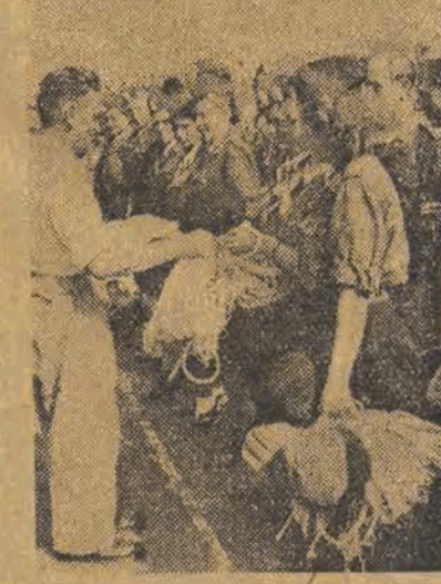
W ramach uroczystości rozpoczęcia roku szkolnego młodzież szkolna otrzymała sprzęt sportowy