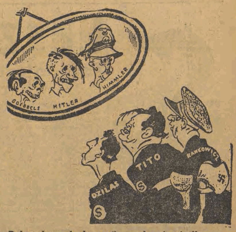
Belgradzcy „fueherzy” przed zwierciadłem...