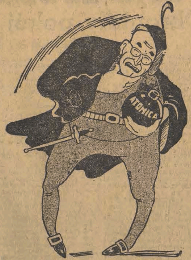
Truman: A-TOM wpadł! — Czym tu teraz straszyc świat?

Jeśli chodzi o kontrolę nad bronią atomową, to należy stwierdzić, że kontrola będzie konieczna, aby sprawdzić wykonanie uchwały o zakazie produkcji broni atomowej.