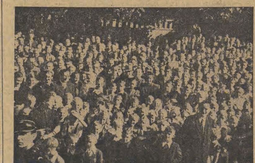
Tysiące dzieci i młodzieży łódzkiej — słuchają przemówienia tow. premiera podczas uroczystego otwarcia szkoły na Karolewie.