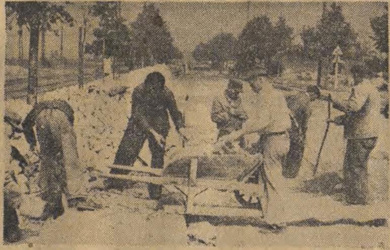
Ulica Strykowska uzyskuje obecnie nową nawierzchnię. Plan przed widywał ukończenie robót na dzień 1-go listopada.