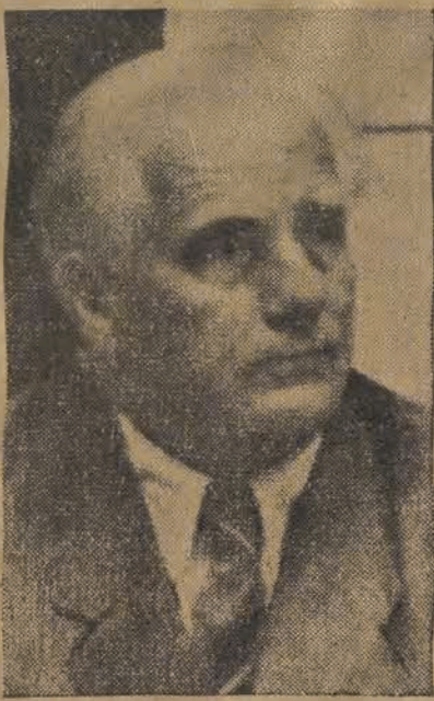
BERLIN (PAP) — We wtorek, dnia 11 bm. na uroczystym posiedzeniu...

stwierdza prezydent Demokratycznej Republiki Niemieckiej