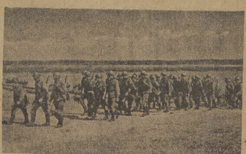
Piechota I-iej Dywizji rusza do ataku na hitlerowców pod Lenino