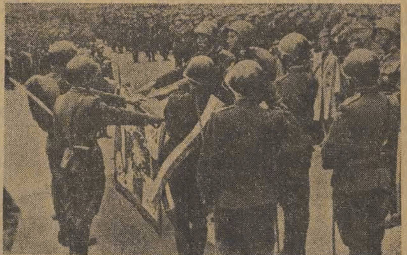
Sześć lat temu — pod Lenino — oddziały I-iej Dywizji Kościuszkowskiej — u boku Armii Radzieckiej — stoczyły zwyciężczy bój z hordami hitlerowskich najeźdźców. Ta pierwsza walka — rozpoczynająca historyczny marsz żołnierza polskiego na Berlin — przeszła do historii chwaty polskiego oręza. — Na zdjęciu — przysięga Kościuszkowców

UWAGA REDAKTORZY GAZETEK ŚCIENNYCH I KORESPONDENCI FABRYCZNI „GŁOSU”! Dnia 14-go października br., tj. w najbliższy piątek — o godzinie 18-jej odbędzie się odprawa redaktorów gazetek ścien-nych łódzkich zakładów pracy i korespondentów fabrycznych „Głosu Robotniczego” w lokalu Redakcji. Prosimy o punktualne przybycie na odprawę. REDAKCJA „GŁOSU ROBOTNICZEGO”.