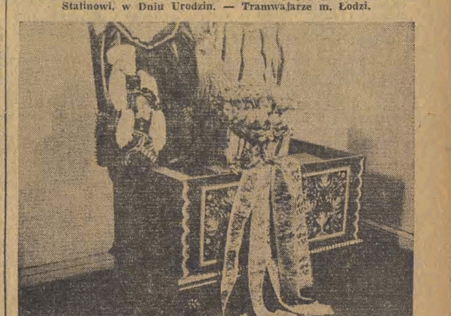
Dar robotników i pracowników gminy Bielawa pow. łowicki — malowana skrzynia pełna regionalnych strojów łowickich.