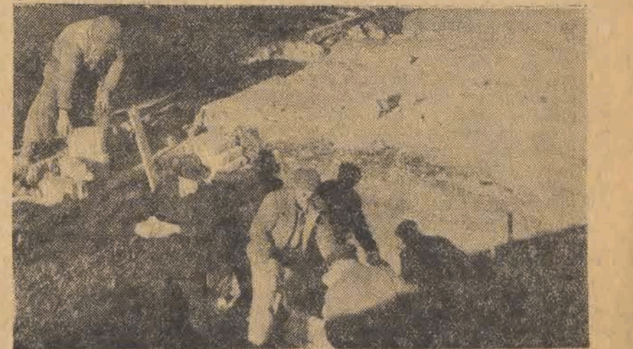
Pracownicy umysłowi pomagają pracownikom fizycznym.

Jeszcze jedną robotę ziemną postanowiła wykonać załoga PZZPP Nr 2. Jest to przerobienie wielkiej