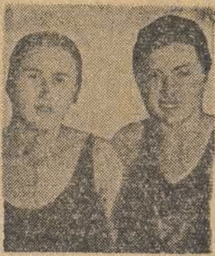
Katalowa i Niedziółna wraz z Bemówną ustanowiły w r. ub. nowy rekord Polski w sztafecie 3x100 st. zmiennym.