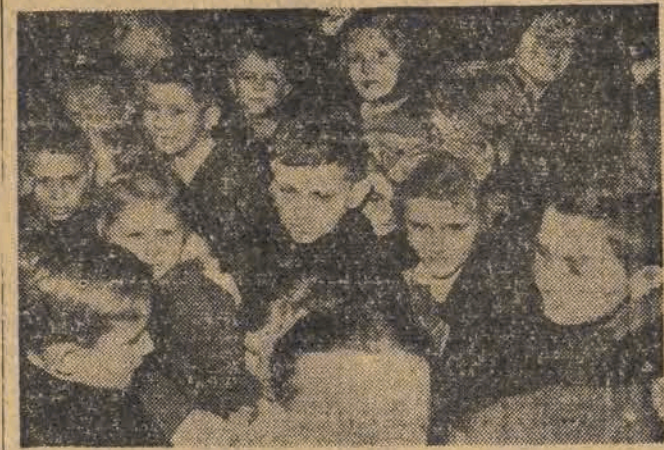
W ubiegłą niedzielę Związek Inwalidów W. P. przygotował miłą niespodziankę dla 750 dzieci — sierot po ofiarach barbarzyństwa hitlerowskiego oraz dzieci przodowników pracy.

kowska, Telefoniczna, Poziomkowa i inne. Na niektórych ulicach przedmieść zostaną nadto ułożone chodniki z płyt. W ramach ustalonych planów, na niektórych peryferiach zostaną przebite nowe ulice, prowadzące do podmiejskich osiedli. Prócz tego w robotach interwencyjnych przewidziane jest rozebranie murów zdewastowanych budynków i pozostałości jeszcze schronów przeciwlotniczych w różnych częściach miasta.