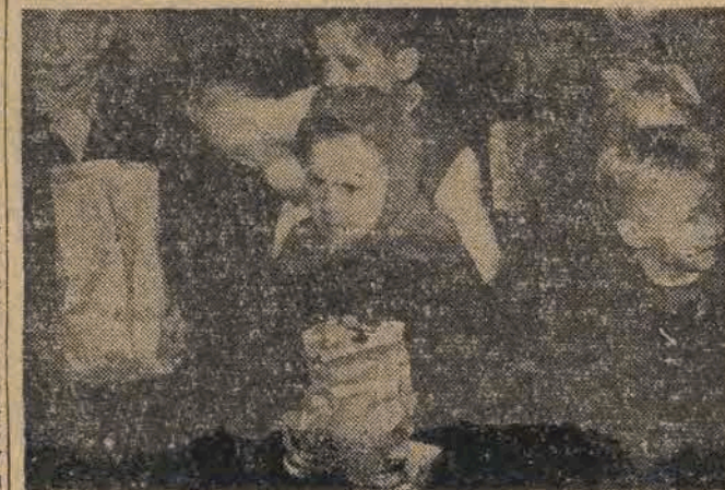
a potem otrzymały noworoczne upominki — paczki z niespodziankami, które wywołały prawdziwy zachwyt dzieci.