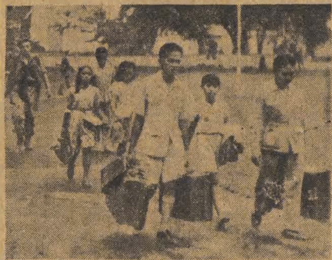
Na wzór Hitlera wysiedlają Indonezyjczyków najezdźcy holenderscy

państw postanowili bacznie śledzić rozwój sytuacji w Indonezji i zwołać niezwłocznie zebranie w wypadku, gdyby do Rady Bezpieczeństwa wpłynął wniosek o zastosowanie wobec Holandii sankcji w związku z jej agresją w Indonezji.