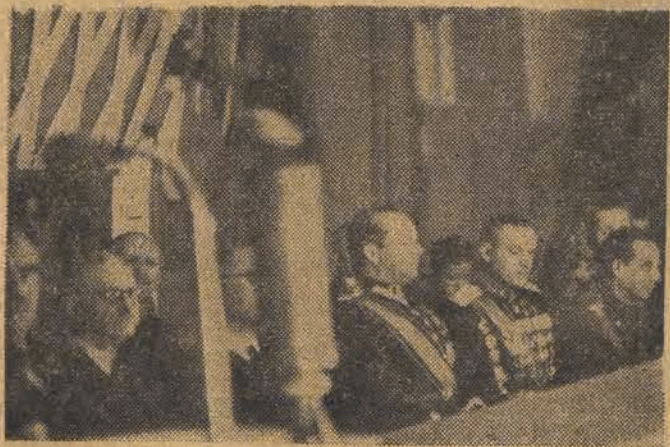
Prezydium uroczystej akademii w Warszawie — marszałek Zymierski, marszałek Rokossovski i gen. Sychalski