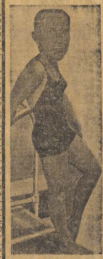
Patrz: „Tajemnica Szymury”