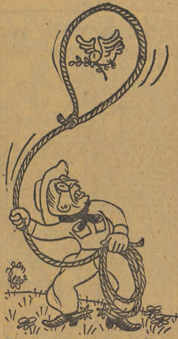
Truman — cowboy imperialistów

tychczas do współzawodnictwa przystąpiły: Biuro Personalne, Wydział Ruchu, Wydział Drogowy, Wydział Elektryczny i Wydział Ochrony Kolei. Zorganizowano komitet współzawodnictwa, którego zadaniem będzie koordynowanie i kontrolowanie przebiegu współzawodnictwa. Wprowadzenie współzawodnictwa w DOKP jest dowodem, że inteligencja pracująca nie pozostaje w tyle w walce o przedterminowe wykonanie planu. Jan Karliński Kolejowy korespondent „Głosu”