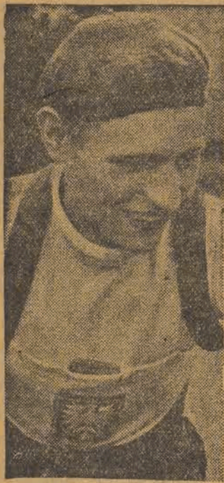
Czyż, b. zawodnik ŁKS, reprezentować będzie i w tym roku w wyścigu P-W nasze barwy państwowe. Wykazał on na obozie w Polanie, doskonałą formę.