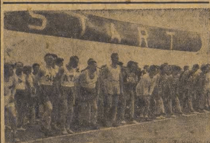
Tegoroczne Biegi Narodowe stały się wielką manifestacją fizycznej naszej młodzieży. Na starcie stanęło w tym roku około pół miliona zawodników, ubiegających się o Odznakę Sportową

Uroczystość rozdania nagród za wyścig „P-W” WARSZAWA (obsł. wł.) - W sali widowiskowej Polskiej YMCA odbyło się we wtorek wieczorem uroczyste rozdanie nagród za międzynarodowy wyścig kolarski Praga - Warszawa. Scena, na której znajdował się stół prezycialny, udekorowana była flagami wszystkich państw, uczestniczących w wyścigu. Ponad sceną wisiał transparent z napisem: „Bojownicy o pokój wszystkich krajów łączcie się”.