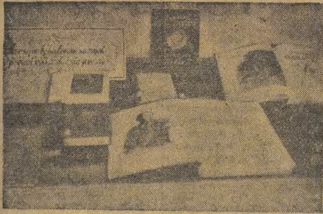
Wspaniałe wydanie „Piotra I” Aleksieja Tołstoja i „Czapajow” Furmanowa — są dowodem wysokiej kasy drukarstwa radzieckiego

Co oglądamy na Wystawie Książki Radzieckiej w Centralnej Szkole PZPR