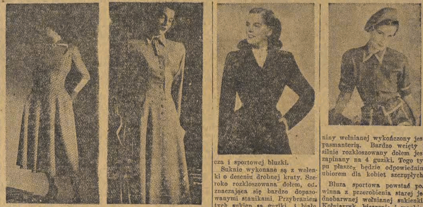
Dzisiaj przedstawiamy naszym Czytelnikom na załączonych rysunkach modele wiosenno-letnich sukien wełnianych, płaszcz i sportowej bluzki.

Suknie wykonane są z welenki o deseni drobnej kraty. Szeroko rozkloszowana dołem, odznaczająca się bardzo dopasowanymi stanikami. Przybranię tych sukien są guziki i białe, pikowe kołnierzyki.