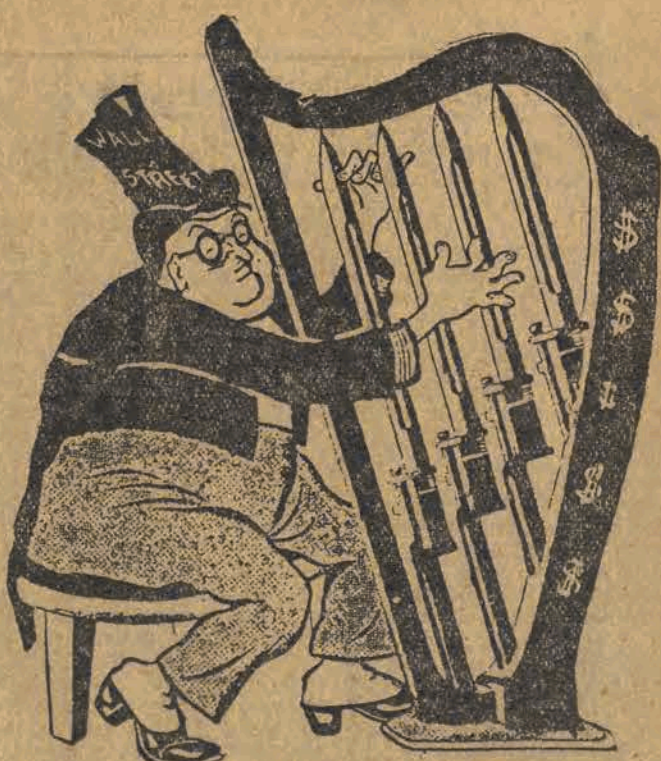
Koncert podżegaczy wojennych

Uchwała Rady Państwa WARSZAWA (PAP). — Rada Państwa podjęła uchwałę zlecającą Najwyższej Izbie Kontroli stałe kontrolowanie wszystkich związków i instytucji, korzystających z pomocy Państwa lub wykonujących czynności zlecone w zakresie administracji publicznej i gospodarstwa narodowego.