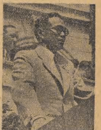
TOW. TSIEN-CHUN-SIN, Główny Ludowy