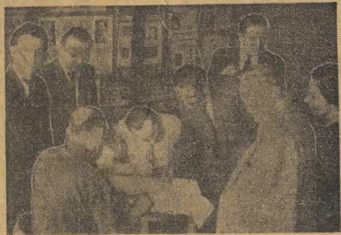
Delegaci na Kongres — salutują ostatnie formalności.