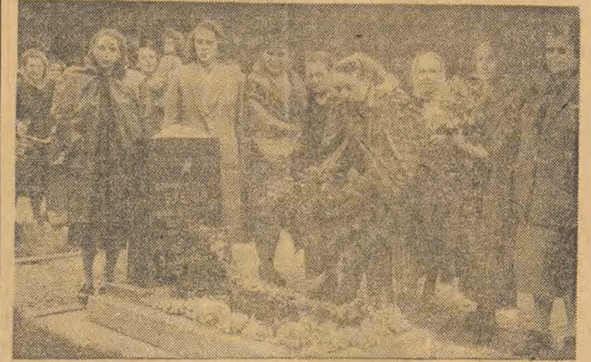
Groby żołnierzy radzieckich poległych w obronie wolności naszego kraju, znajdują się pod czułą i troskliwą opieką polskich kobiet oraz polskiej młodzieży. W przededniu 5-tej rocznicy Odrodzenia, kobiety łódzkie masowo podjęły akcję przybierania grobów żołnierzy radzieckich kwiatami. Na fotografii widzimy grupę członkiń Ligi Kobiet przy tej pracy.