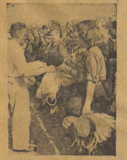
W ramach uroczystości rozpoczęcia roku szkolnego młodzież szkolna oczymała sprzęt sportowy