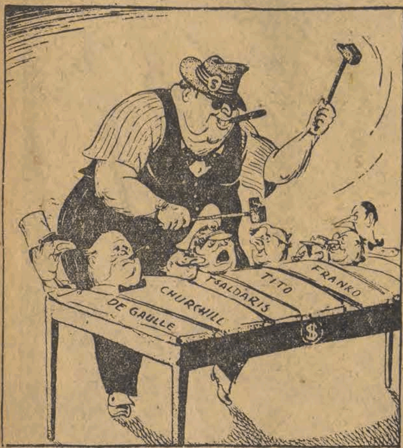
„Koncert zachodnio-europejskiej współpracy”