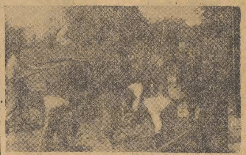
Junacy hufca SP przy Średniej Szkole Tow. Salezjańskiego z inicjatywą ZMP-owców powzięli zobowiązanie przetwarzania 3 dni z przeznaczaniem zarobku na Odbudowę Warszawy.

Na zdjęciu widzimy junaków pracujących nad uporządkowaniem terenu fabryki im. Ofiar 10 Września 1907 r.