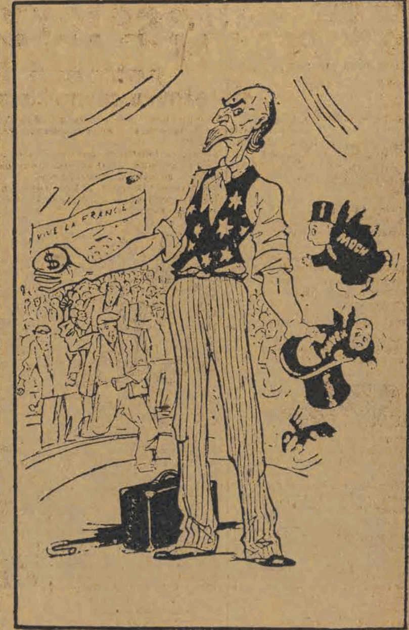
„Próby zmóntowania nowego rządu francuskiego spotykają się z silnym oporem mas ludowych” (z prasy)