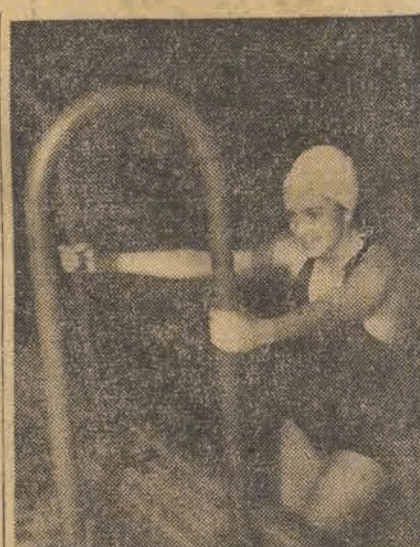
Proniewiczówna (ŁKS Włókniarz)

linowska E. ŁKS WI. 100 mtr stylem wznak mężczyzn - 1. Oweczarek Warta 1.19,2; 2. Sierociński ŁKS WI.