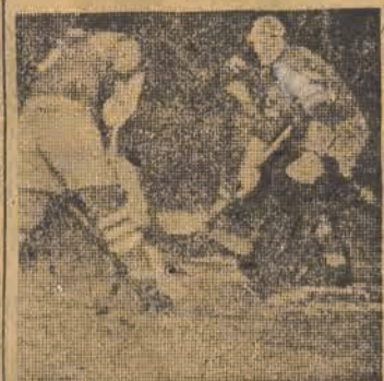
między „Włókniarzem” z Zgierza a drużyną „Len” z Wałbrzycha zakończył się sukcesem gospodarzy, którzy w końcowej tabeli uplasowali się na pierwszym miejscu przed „Len” (Wałbrzych), PKS (Pabianice) i Żyrardowianką.