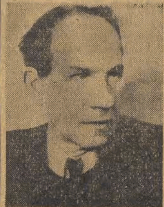
Premier ČSR A. Zapotocky

W tym duchu żywe czechosłowacko-polskie sojusze wielu dalszych sukcesów. Jednocześnie obszernie oświadczenia z okazji II rocznicy podpisania układu złożył minister spraw zagranicznych Czechosłowacji dr Vlado Clementis oraz prezes Tow. Przyjaźni Czechosłowacko-Polskiej i minister handlu zagranicznego, dr A. Gregor.