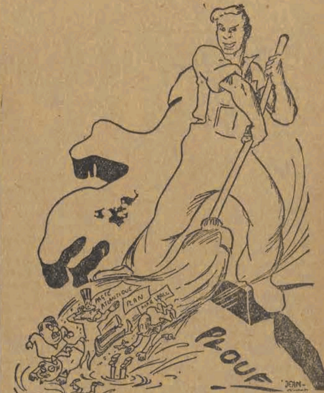
Gdy lud francuski zabierze decydujący głos... (France Nouvelle)

Zagajając Konferencję przewodniczący Komitetu Organizacyjnego prof. Shapley oświadczył w odpowiedzi na wrogą kampanię kół reakcyjnych i większości prasy, że Konferencja Nowojorska jest imprezą zorganizowaną przez intelektualistów amerykańskich bez różnicy poglądów politycznych.