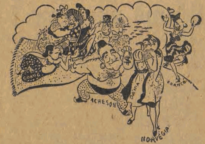
EUNUCH ACHESON: — Prosimy, szanowne panie, jest jeszcze kilka wolnych miejsc w haremie Trumana - paszy! (Tvorba)

Zjazd ten będzie obradować pod znakiem pogłębienia się so-