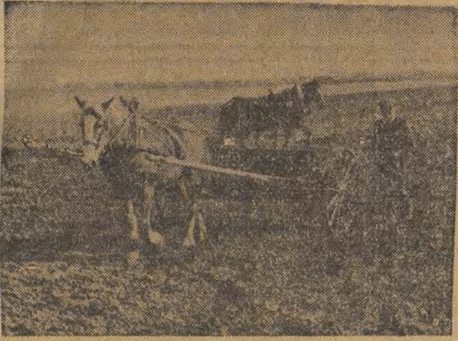
Chłopi mało i średniorolni zrozumieć jakże konieczni dają siew rzędowy.