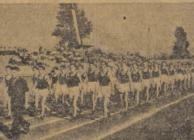
1.300 sportowców na stadionie LKS Włókniarza