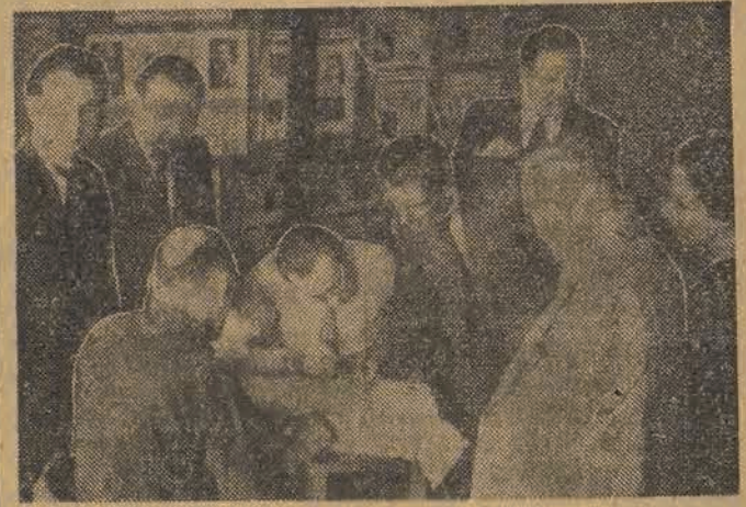
Delegaci na Kongres — salutują ostatnie formalności.