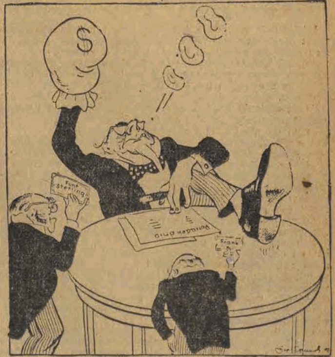
5-ty punkt umowy — podpisanej w Waszyngtonie przez rządy USA, W. Brytanii i Francji — stwierdza, że w sprawach kontroli nad przemysłem zachodnich Niemiec trzy powyższe mocarstwa posiadają prawo głosu... proporcjonalnie do ilości gotówki włożonej w odbudowę tegoż przemysłu.

„Pięciolatka w cztery lata!” — oto hasło całego narodu radzieckiego, stwierdza „Prawda”.