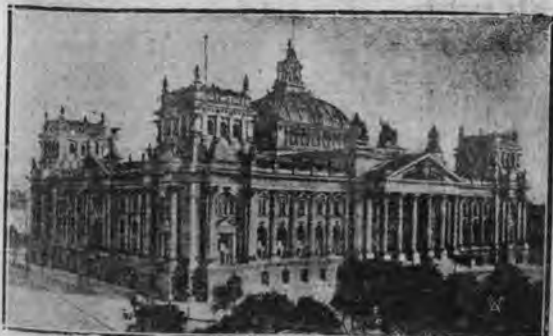
Gmach parlamentu niemieckiego który w ub wtorek padł ofiarą pożaru. Plomienie poczyniły wewnątrz olbrzymiego gmachu kolosalne spustoszenie. Pasjąga pożaru padła główna sala posiedzeń, kulturalny i trybuna dla publiczności. Straty sięgają milionowych sum