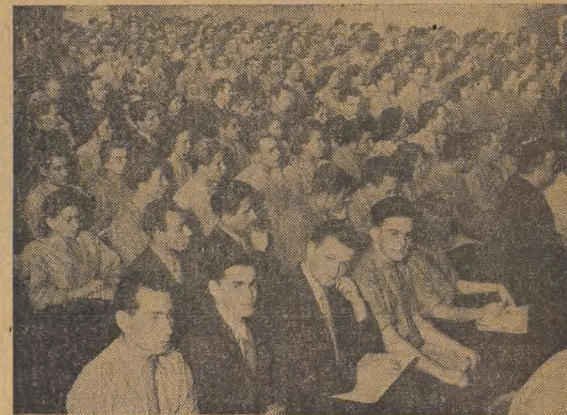
Wielka sala Filharmonii — wypełniona delegatami łódzkich dzielnic ZMP — słuchającymi w skupieniu przemówień.