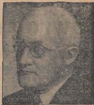
Dotychczasowy ambasador niemiecki w Tokio Dirksen został mianowany ambasadorem Rzeszy w Londynie.

Redaktor lub jego zastępca przyjmuje od g. 3 do 4 po poł. — Administracja czynna — od g. 8 rano do g. 10 bez przerwy. — Wydział Ogłoszeń tel. 182-4 Filia ul. Piotrkowska 11, tel. 102-29 Wydział Prenumeraty tel. 182-48 Oplata pocztowa uiszczona gotówką.