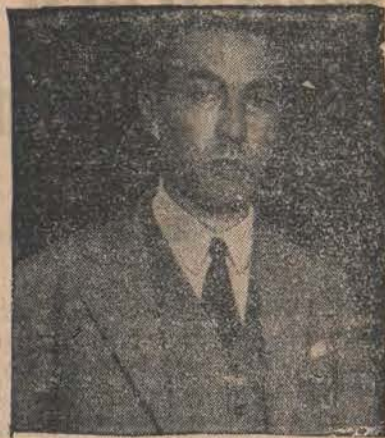
Obłożnie chory od pewnego czasu premier japoński ks. Konoye, powraca obecnie do zdrowia.

Redaktor lub jego zastępca przyjmuje od g. 3 do 4 po poł. — Administracja czynna — od g. 8 rano do g. 10 bez przerwy. — Wydział Ogłoszeń tel. 182-41 Filia ul. Piotrkowska 11, tel. 102-29 Wydział Prenumeraty tel. 182-48 Opłata pocztowa uiszczona gotówką.